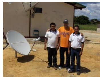
Fig. 1 Instalación de la antena de telemedicina. Cacurí. Estado Amazonas.

En esa ocasión, no solo se trató de la instalación de la antena y equipos de computación, equipos de hardware (computadoras, impresoras, cámara digital, web cam, telefonía IP, ente otros) y software que se nutrían de baterías recargadas por células fotorreceptoras, sino, además, se preparó al personal a cargo (indígena de la etnia Yekuana) para el manejo del sistema de comunicación y fotografía digital en las instalaciones de la UCV